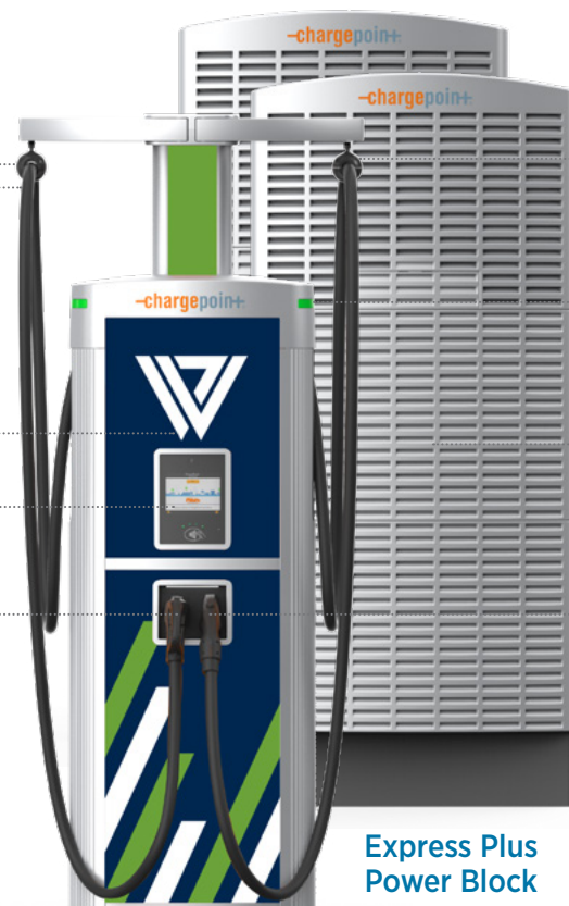
Express Plus Power Link

Rechargez pratiquement n'importe quel véhicule électrique avec le port Omni de ChargePoint®, qui distribue automatiquement un connecteur CCS1 ou NACS (Tesla) correspondant au VÉ en cours d'utilisation.