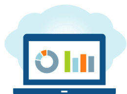
Tableau de bord basé sur le Cloud pour vous aider à gérer la consommation d'énergie, les coûts et le retour sur investissement